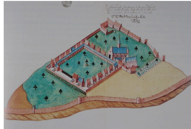
De Bersaques: De Kartuis in 1596.

In de loop der eeuwen is het klooster herhaaldelijk het voorwerp geweest van geweld en vandalisme. Nadat de Kartuziers het pand dienden te verlaten tijdens het Oostenrijks bewind, werd de inboedel verkocht en de gebouwen verder vernield na de Franse revolutie. In 1806 werd de kerk afgebroken. Het klooster diende een tijd als kazerne en munitiedepot en een ontploffing deed de rest.